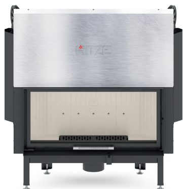
ALBERO AL19 G.H