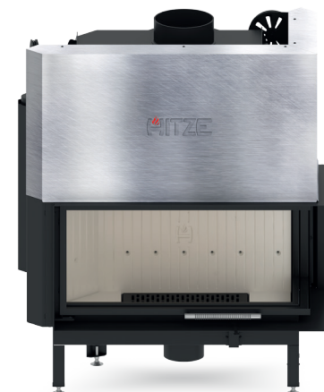
ALBERO AL19 RG.H