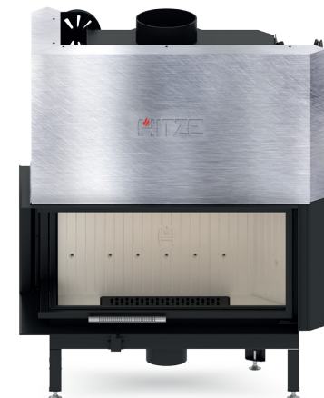
ALBERO AL19 LG.H