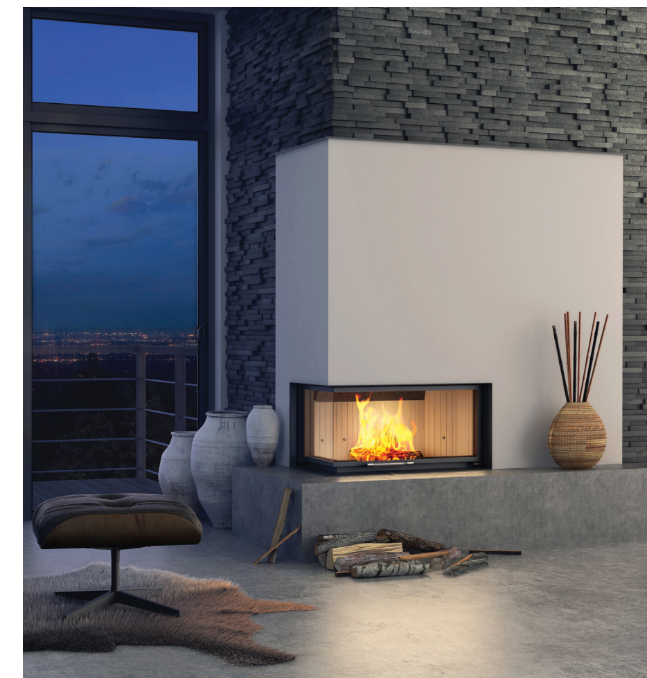
Wkład kominkowy ALBERO AL19 LG.H