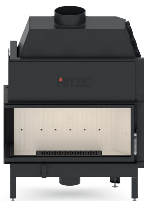
ALBERO AL19 L.H