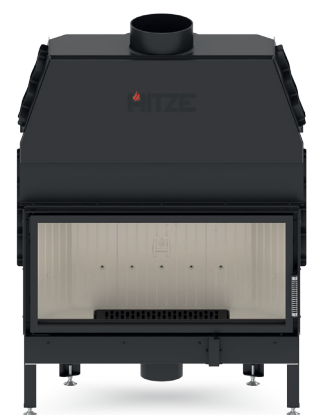
ALBERO AL19 S.H