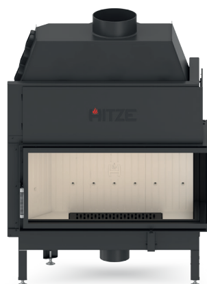
ALBERO AL19 R.H